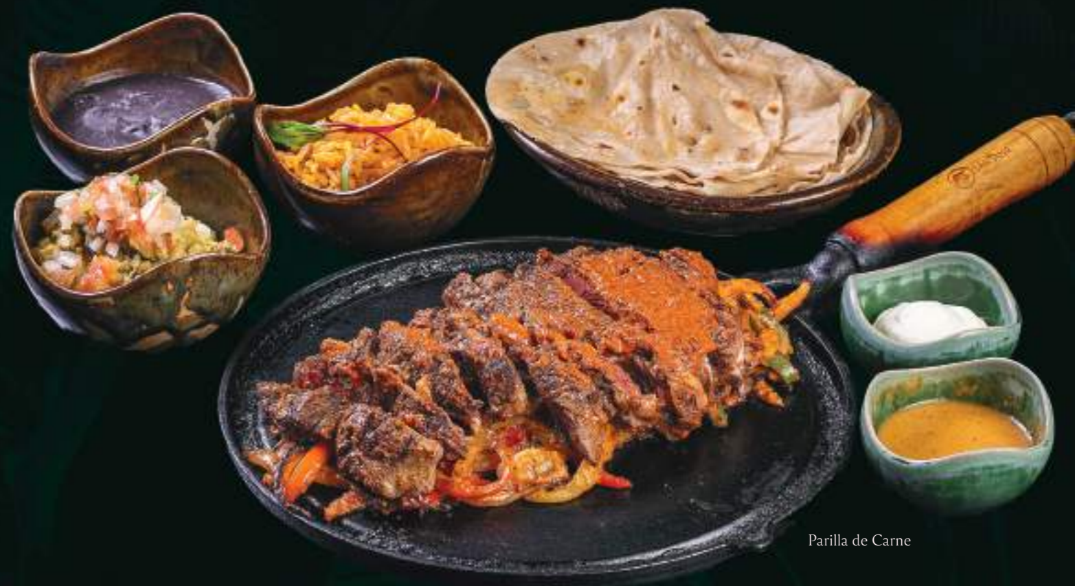
Parilla de Carne