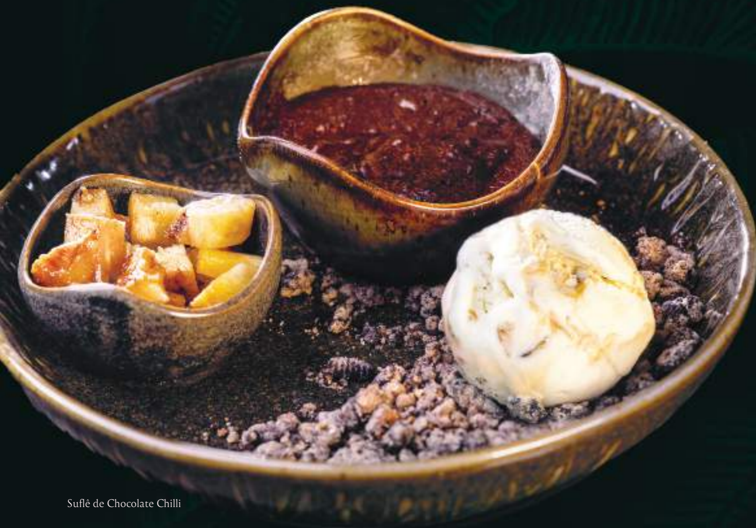
Suflê de Chocolate Chili