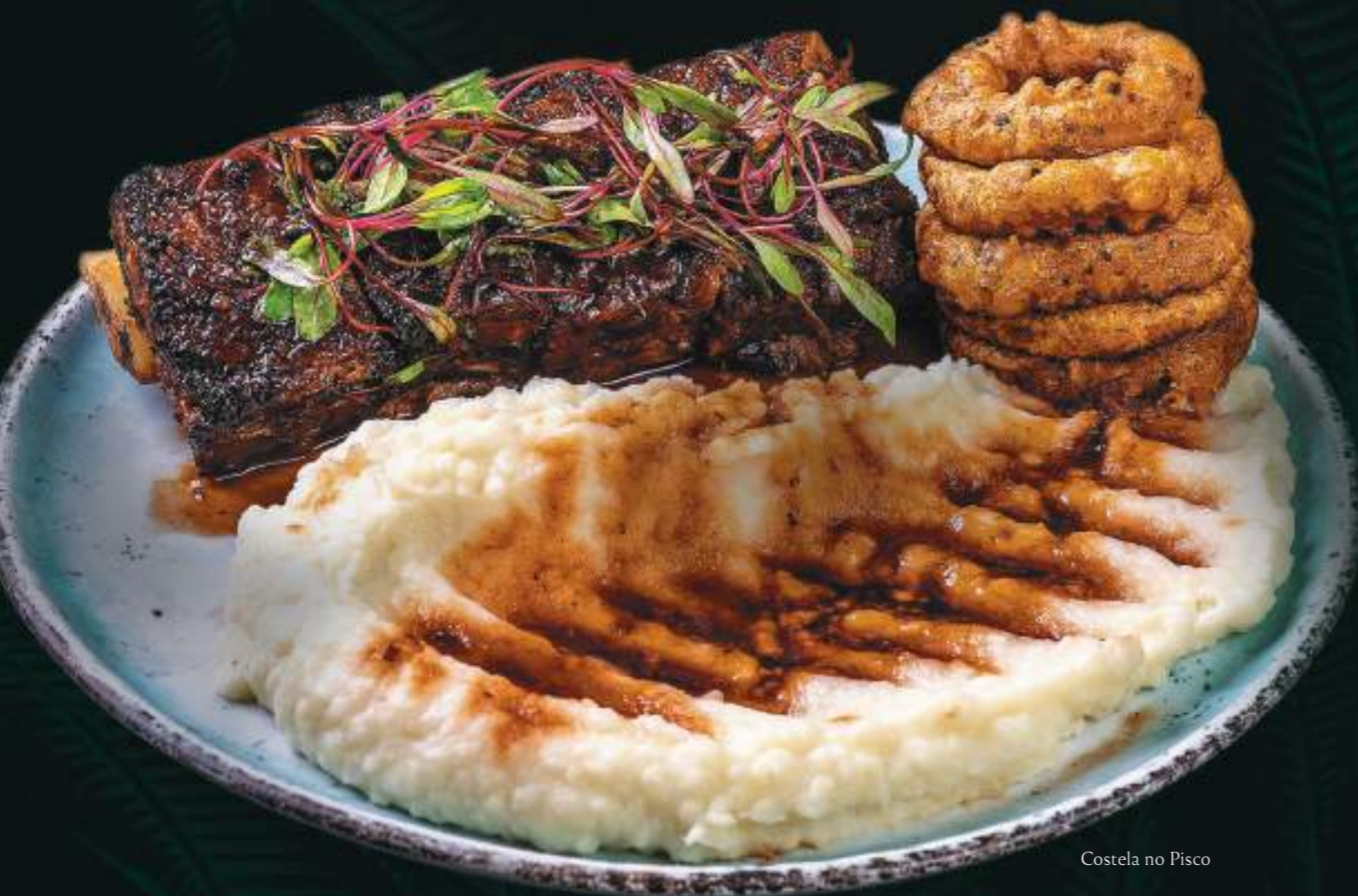
Costela no Pisco