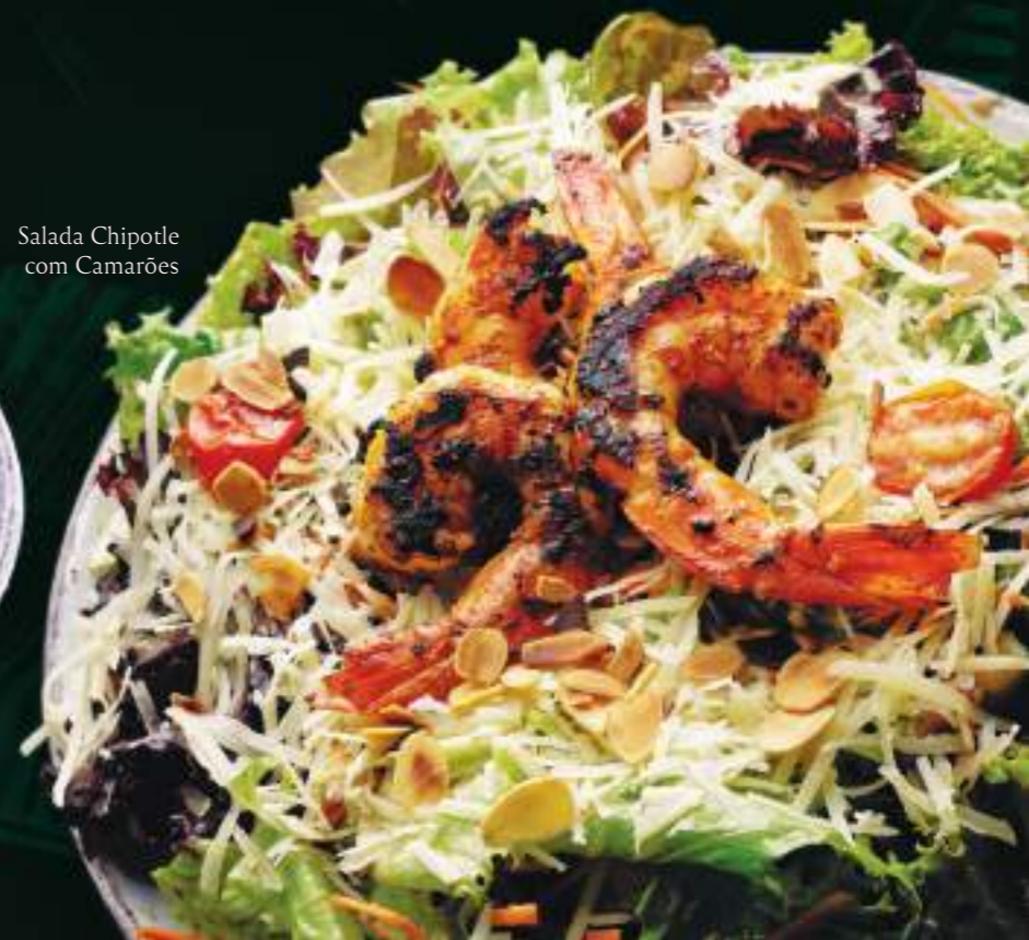
Salada Chipotle com Camarões