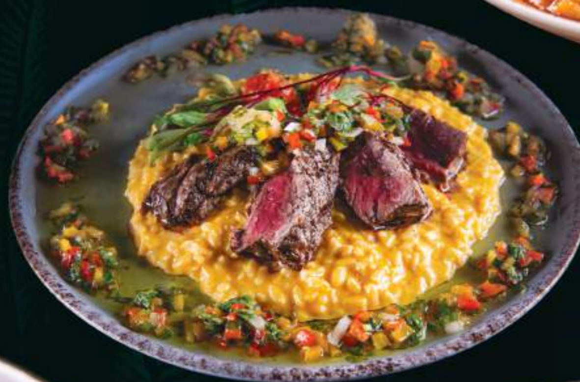
Risoto de Aji Amarillo