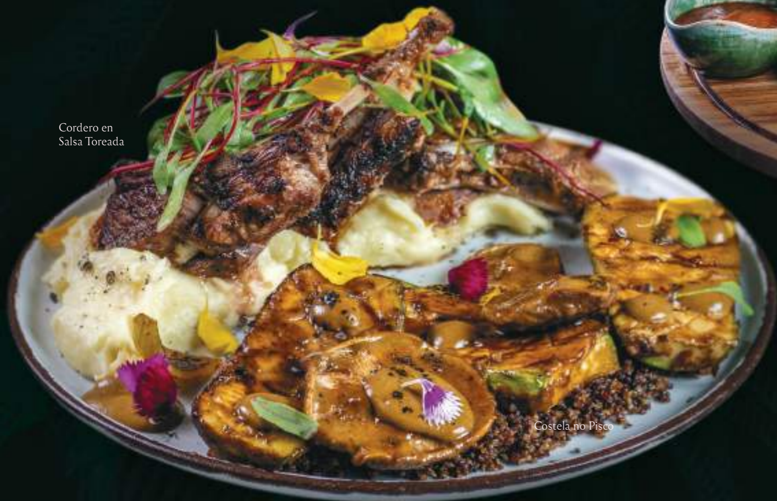
Cordero en Salsa Toreada