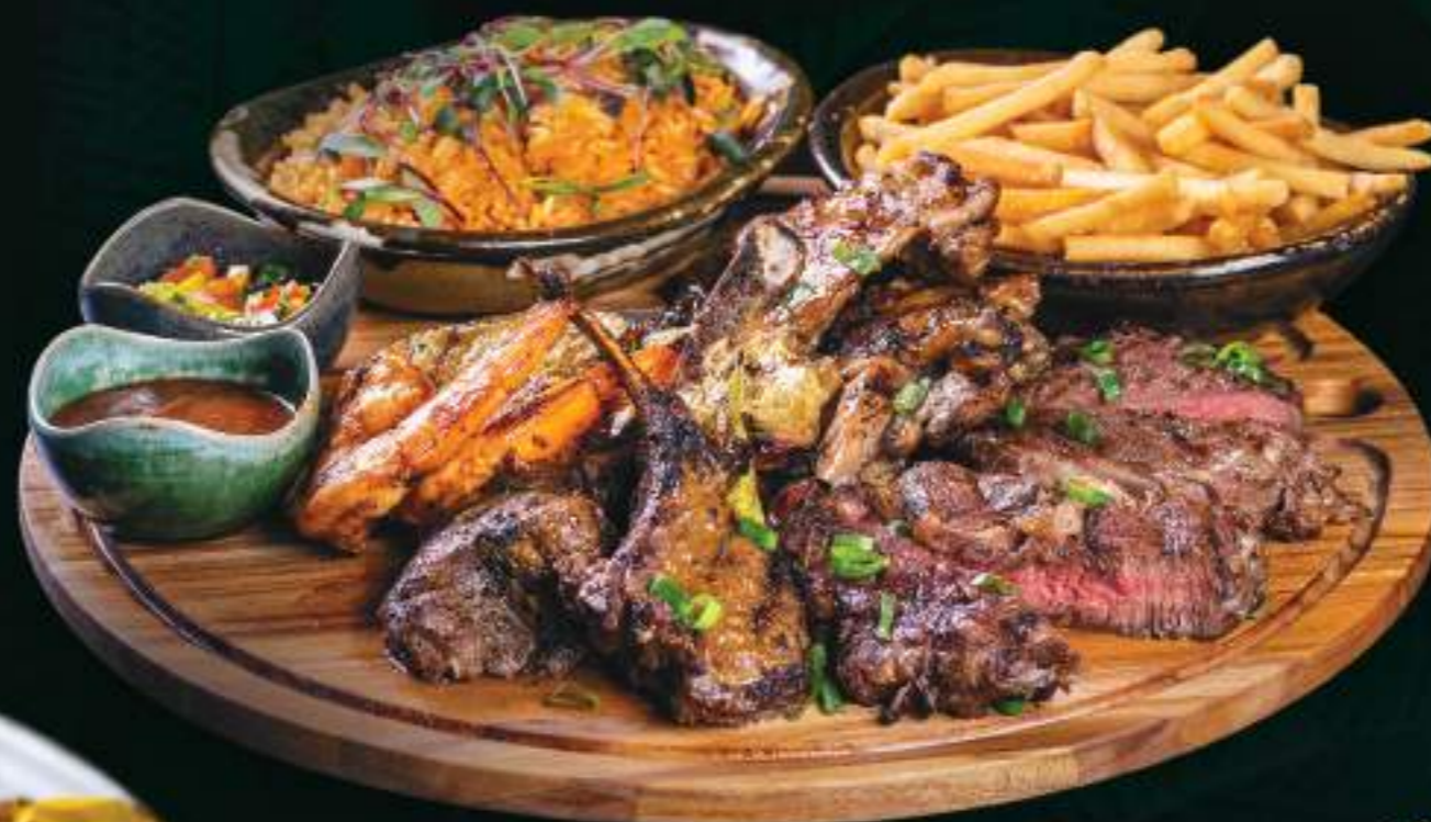
Parrillada Mar y Tierra