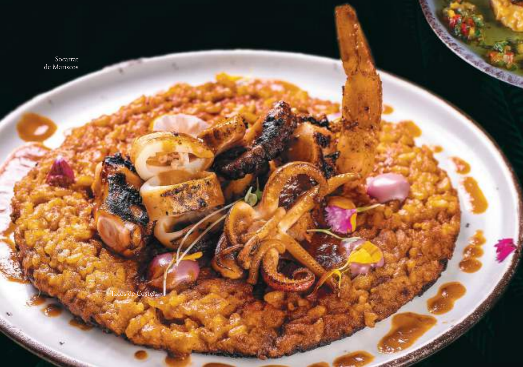
Socarrat de Mariscos