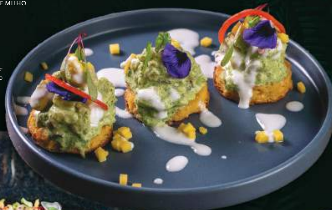
Tatar de Pescado