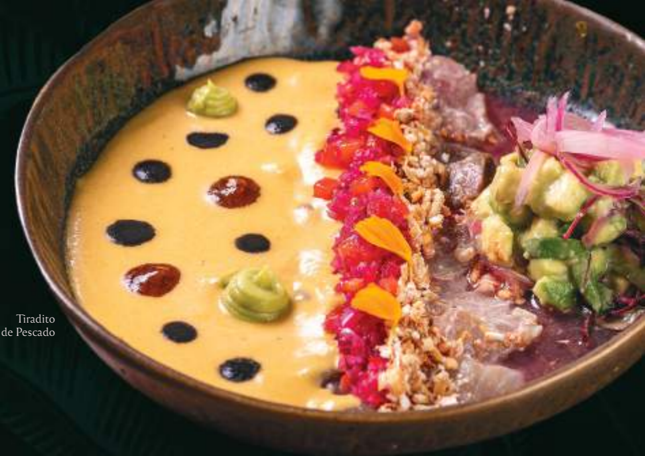
Tiradito de Pescado