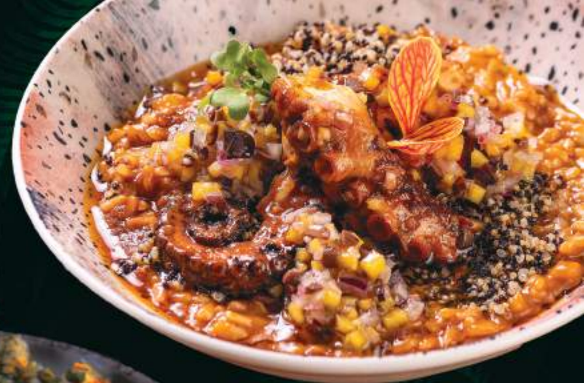
Arroz de Pulpo