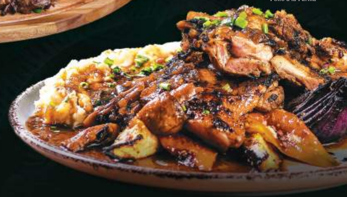
Pollo a la Parilla